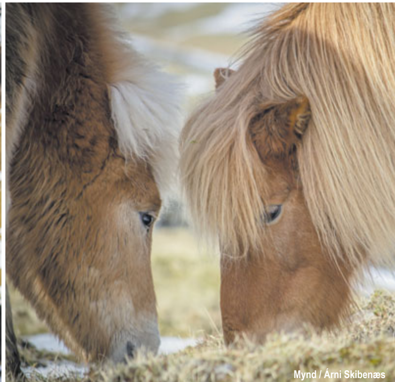
Mynd / Árni Skibenæs

Færeyskir hestar þykja ekki síður barnvænir en frændur þeirra á Íslandi og fótafimir í erfiðu landslagi.