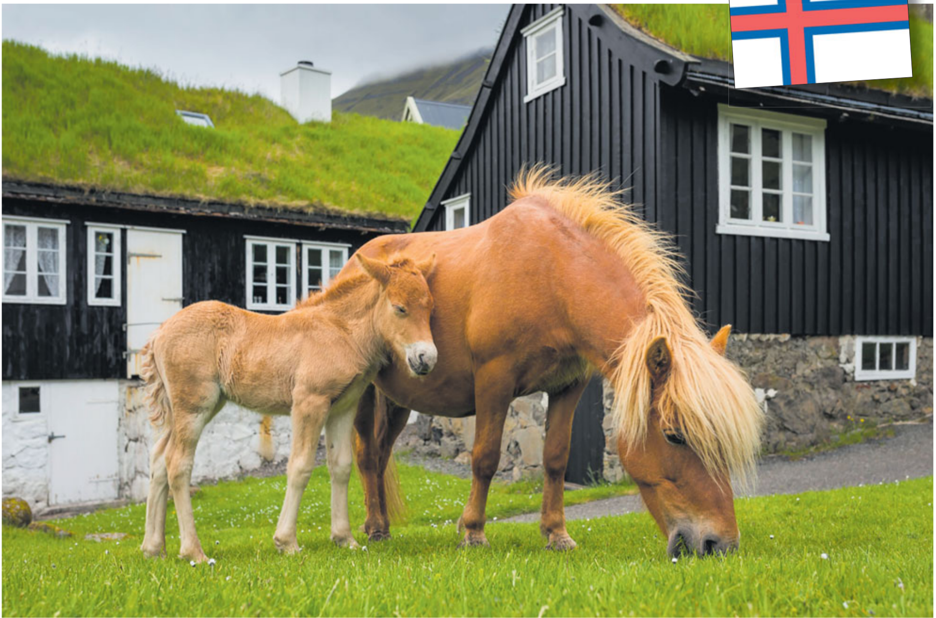
Færeyskir smáhestar. Allir færeyskir hestar í dag eru því afkomendur þriggja mera og eins graðhests.