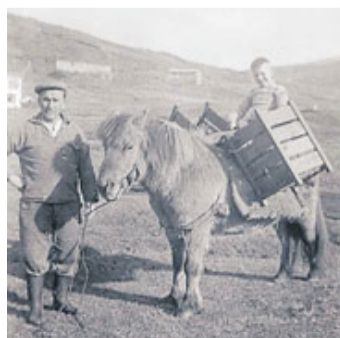
Vegna smæðar hestsins voru þeir aðallega notaðir til burða en þess á milli gengu hrossin sjálfala.